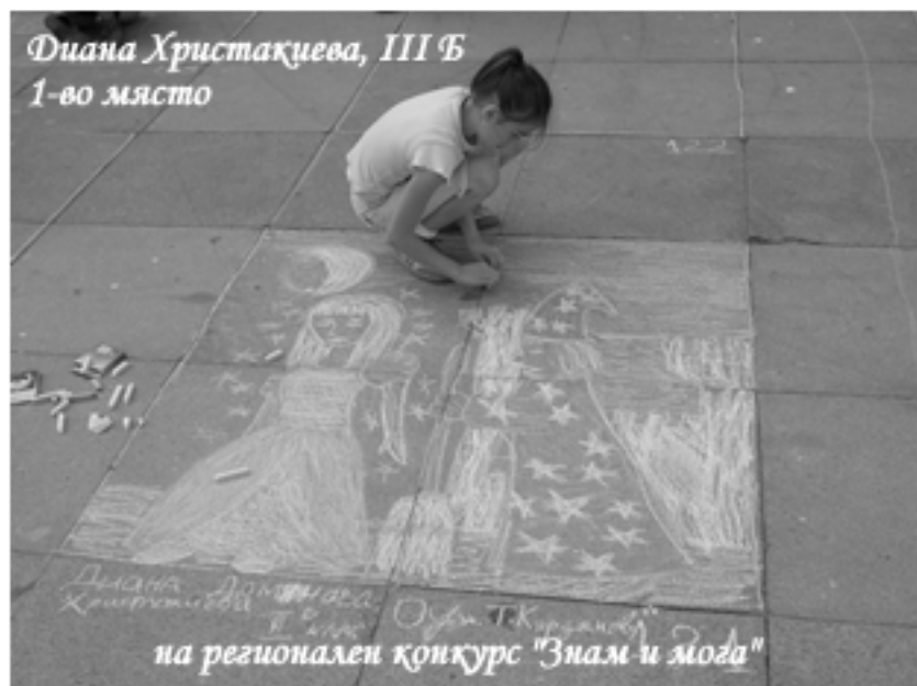
на регионален конкурс "Знам и мога"